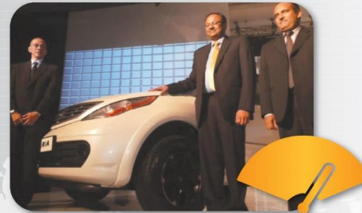
September 2013 Memasarkan produk TATA Motors