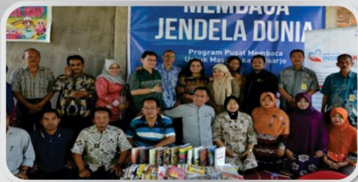
Serah terima Proyek Mobile Community Library @ Sidoarjo pada 22 Oktober 2014