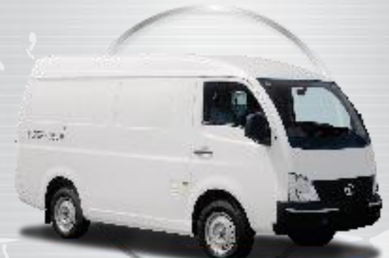
superACE BLIND VAN