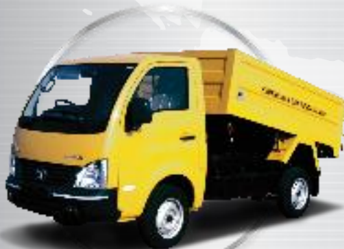
superACE GARBAGE TIPPER