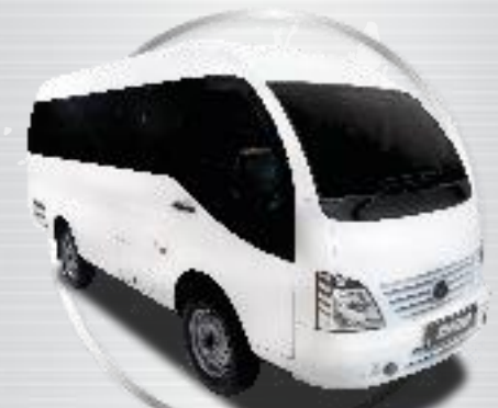
superACE LUXURY VAN