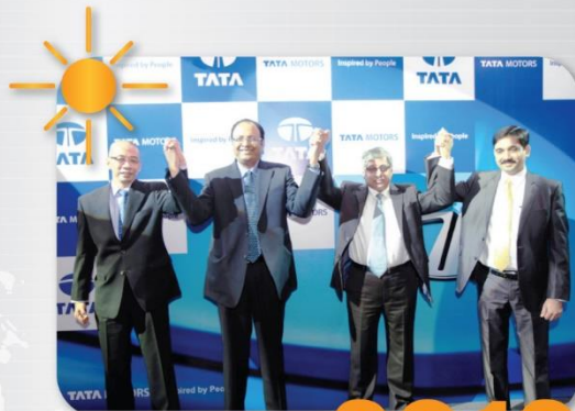
Resmi berdiri 2012