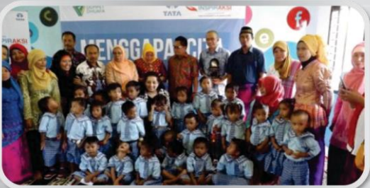
Serah terima Proyek Renovasi Sekolah @ Sumbawa pada 13 Desember 2014