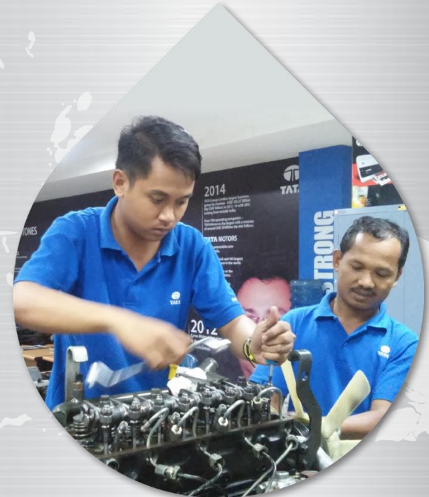
PUSAT PELATIHAN BERFASILITAS LENGKAP