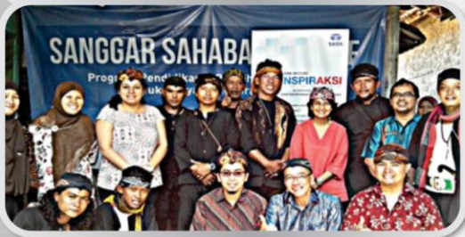
Serah terima Proyek Digital Training Centre @ Karawang pada 26 September 2014