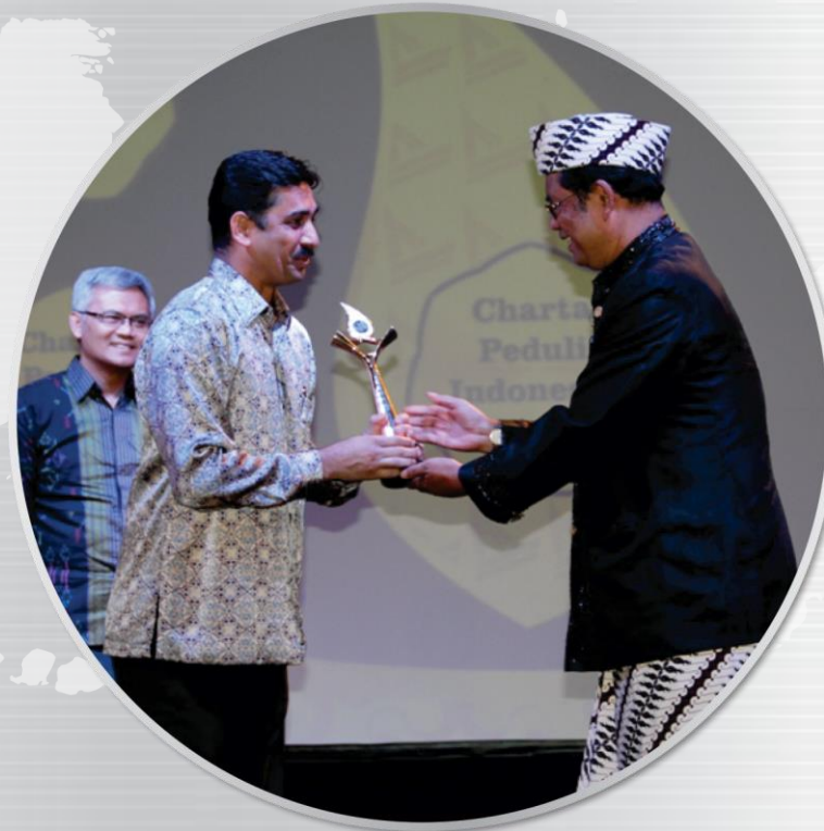
Inspiraksi menerima penghargaan Charta Peduli 2014 di kategori Informal Pengembangan Pendidikan