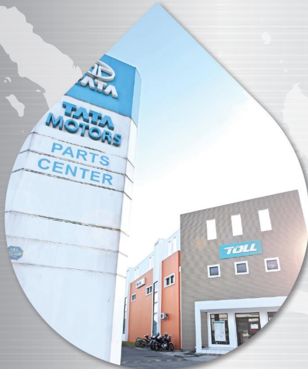
GUDANG PENYIMPANAN SUKU CADANG YANG LENGKAP (25 bulan inventarisasi) Tingkat layanan 99%