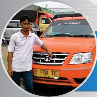
JUMADI, Kabapin Koperasi Pemilik TATA Xenon RX

"TATA Xenon RX punya keunggulan tersendiri. Gagah, konsumsi BBM irit, kuat, ground clearance tinggi yang bisa diandalkan di medan berbatu dan ada hidungnya, lebih aman."