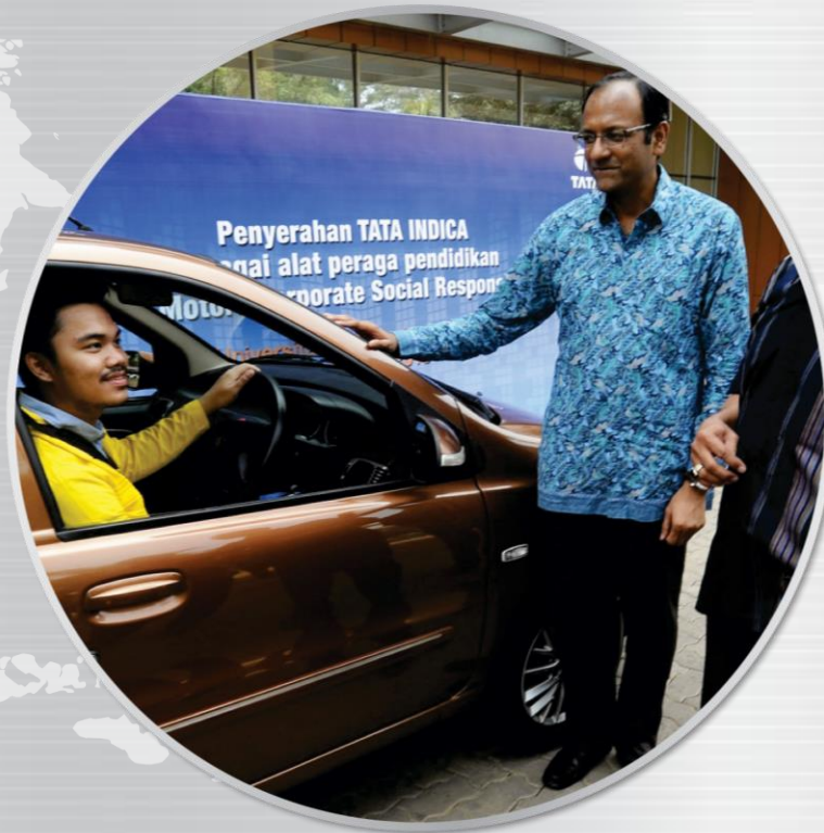
Penyerahan bantuan kendaraan TATA Indica kepada Fakultas Teknik Mesin Universitas Indonesia (UI) pada bulan Oktober 2015.