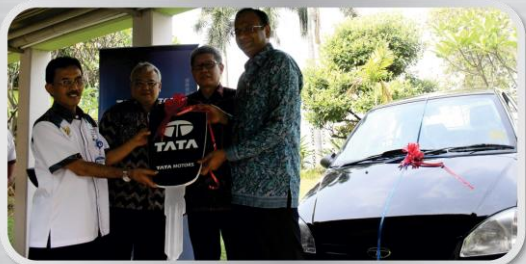
Penyerahan bantuan kendaraan TATA Indigo untuk kepentingan peserta pelatihan BBPLK Cevest yang dilaksanakan di Bekasi, Kamis, 12 Mei 2016.