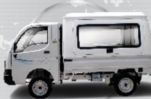
ACE EX 2 MOKO