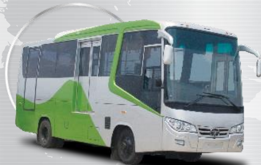
LP 713 - Intra City Bus