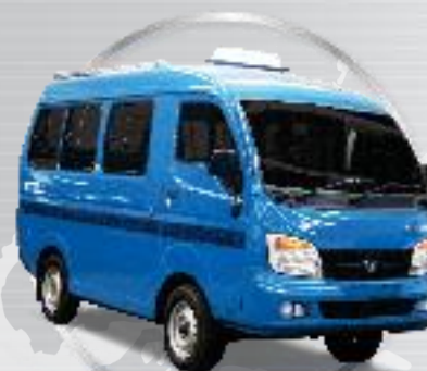
ACE EX 2 ANGKOT