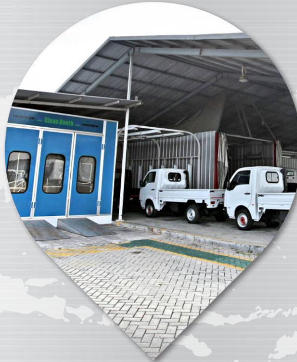
PUSAT PDI CANGGIH Inspeksi Sebelum Pengiriman