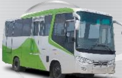
LP 713 - Intra City Bus