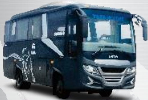
LP 713 - Luxury Bus