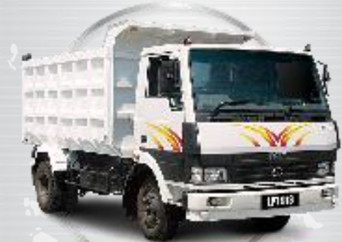
LPT 913 - Tipper