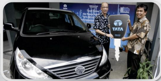
Penyerahan bantuan kendaraan TATA Indigo kepada Fakultas Teknik Mesin Institut Teknologi Bandung (ITB) pada bulan November 2015.