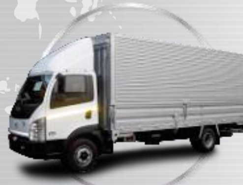
Ultra 1012 45 WB Aluminum wing Box