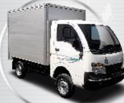
ACE EX 2 BOX