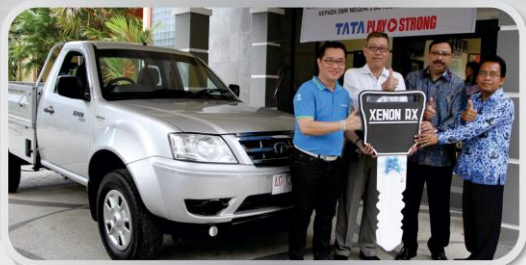
Penyerahan bantuan kendaraan pick-up TATA Xenon RX Diesel ke SMK 3 Boyolangu, Tulungagung, Jawa Timur, Kamis, 17 Maret 2016.