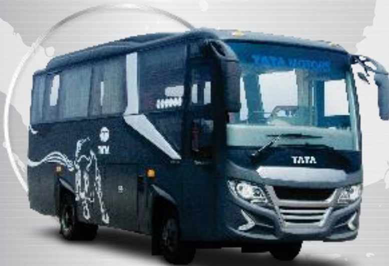
LP 713 - Luxury Bus