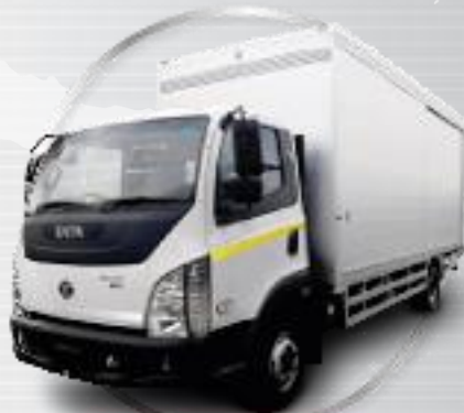
Ultra 1012 45 WB Aluminum box