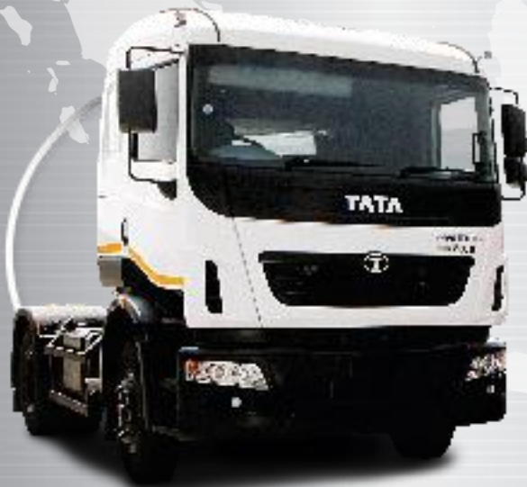
6 x 4 4928.S